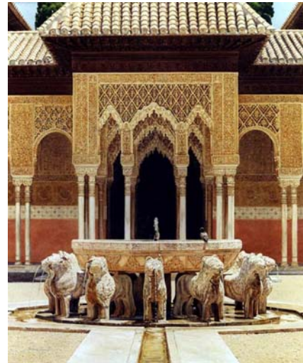
Fuente en el Patio de los Leones de la Alhambra de Granada